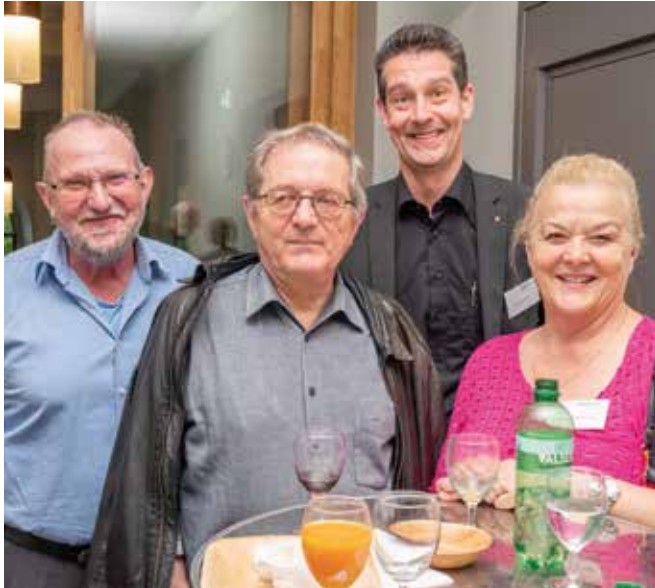
Die Mitglieder des ehemaligen kfmv Olten-Balsthal sind treue GV-Besucher.