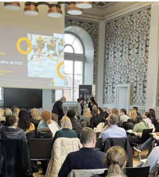
Der Frühlingsanlass (wbp) vom 3. 2. 2023 war ausverkauft.

Herbstanlass besuchten wir Tele M1 und erhielten spannende Einblicke in unseren Regionalsender. Natürlich nutzten wir den anschliessenden Apéro zum Austausch. Nochmals herzlichen Dank an das engagierte Team von Tele M1.